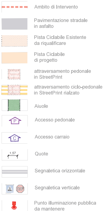
STATO DI PROGETTO - PLANIMETRIA GENERALE INCROCIO S.P. 49 - SUD scala 1:250